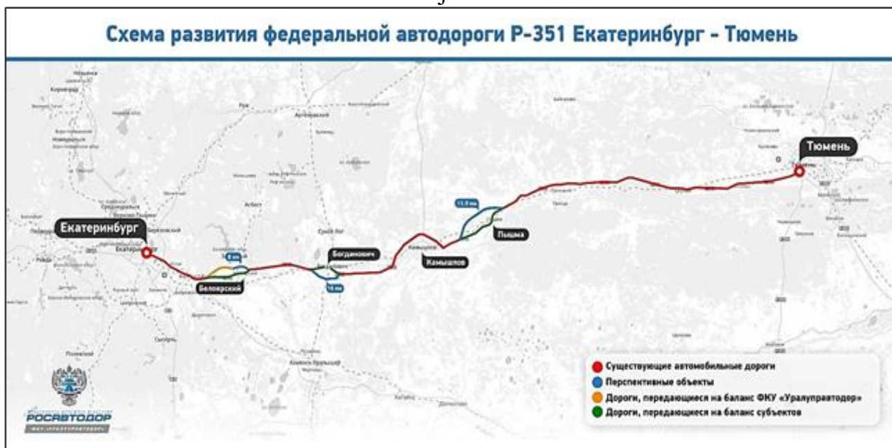
Рисунок 1. Местоположение трассы Р-351 Екатеринбург-Тюмень

В границах зоны размещения на ПК 45 – ПК 60 (вблизи поселка Гагарский) проектируемой дороги сформированы участки, которые в соответствии со сведениями ГЛР относятся к землям лесного фонда и имеют следующий лесной адрес: Свердловское лесничество, Косулинское участковое лесничество, урочище «ТОО Мезенское», квартал 13 (части выделов 36, 37, 38, 40). Исходный земельный участок, на котором находятся проектируемые участки, имеет кадастровый номер - 66:06:0000000:701 (по сведениям ЕГРН – категория земель: земли лесного фонда; статус: ранее учтенный, без координат границ).