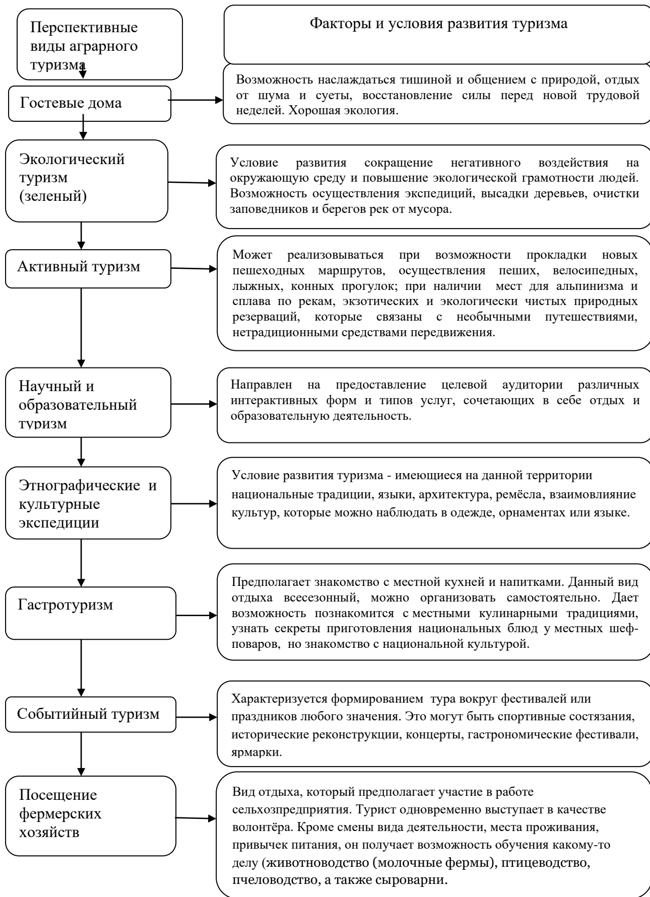
Рисунок 1 - Перспективные виды аграрного туризма, факторы и условия их развития.