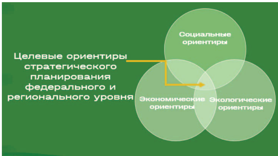
Рисунок 1. Целевые ориентиры стратегического планирования федерального и регионального уровня Figure 1. Targets of strategic planning at the federal and regional levels

Содержанием стратегического планирования становится определение таких направлений и инструментов реализации социально-экономической политики России, при которых достигаются поставленные цели и решаются соответствующие задачи, а использование природных ресурсов [10] приобретает наиболее рациональный и результативный характер. При этом в действующем законодательстве единое легальное определение категории «природные ресурсы» не закреплено, однако в одном из нормативно-технических документов приводится следующее толкование: «Природные ресурсы (natural resources) — ресурсы, обнаруженные в природной среде и полезные для человека и его деятельности» [11]. В объем понятия