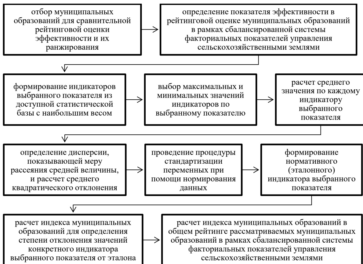
Рисунок 1 – Этапы расчета рейтинговой оценки муниципальных образований в рамках сбалансированной системы факториальных показателей управления сельскохозяйственными землями

образований по соизмеримым равнозначным показателям оценки эффективности управления сельскохозяйственными землями. В этом и состоит основная идея применения и использования таксонометрического метода.