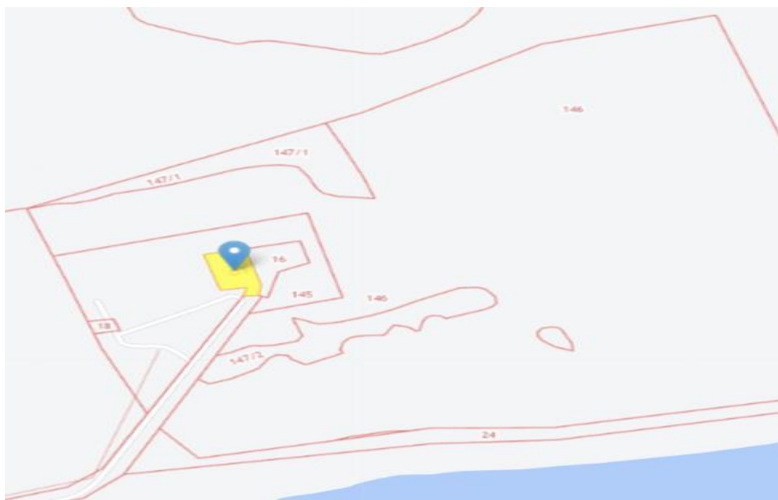
Рисунок 2. Расположение земельного участка на публичной кадастровой карте

Земельный участок имеющий вид разрешенного строительства «для размещения объектов общественного питания» относится к условно разрешенным видам и параметрам использования земельных участков и объектов капитального строительства в соответствии с градостроительным регламентом [8,9].