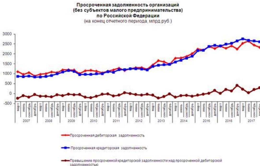
Рис. 4. Изменение просроченной дебиторской задолженности относительно просроченной кредиторской

По данным графикам видно, что в период с 2012 года предприятия имеют пассивное сальдо расчетного баланса.