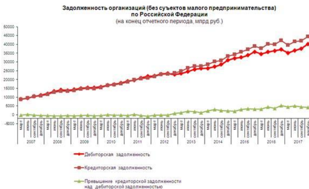
Рис. 3. Изменение дебиторской задолженности относительно кредиторской

На рисунке 3 представлено изменение дебиторской задолженности относительно кредиторской. А на рисунке 4 изменение просроченной дебиторской задолженности относительно просроченной кредиторской.